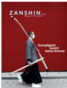
Titelseite der aktuellen Ausgabe